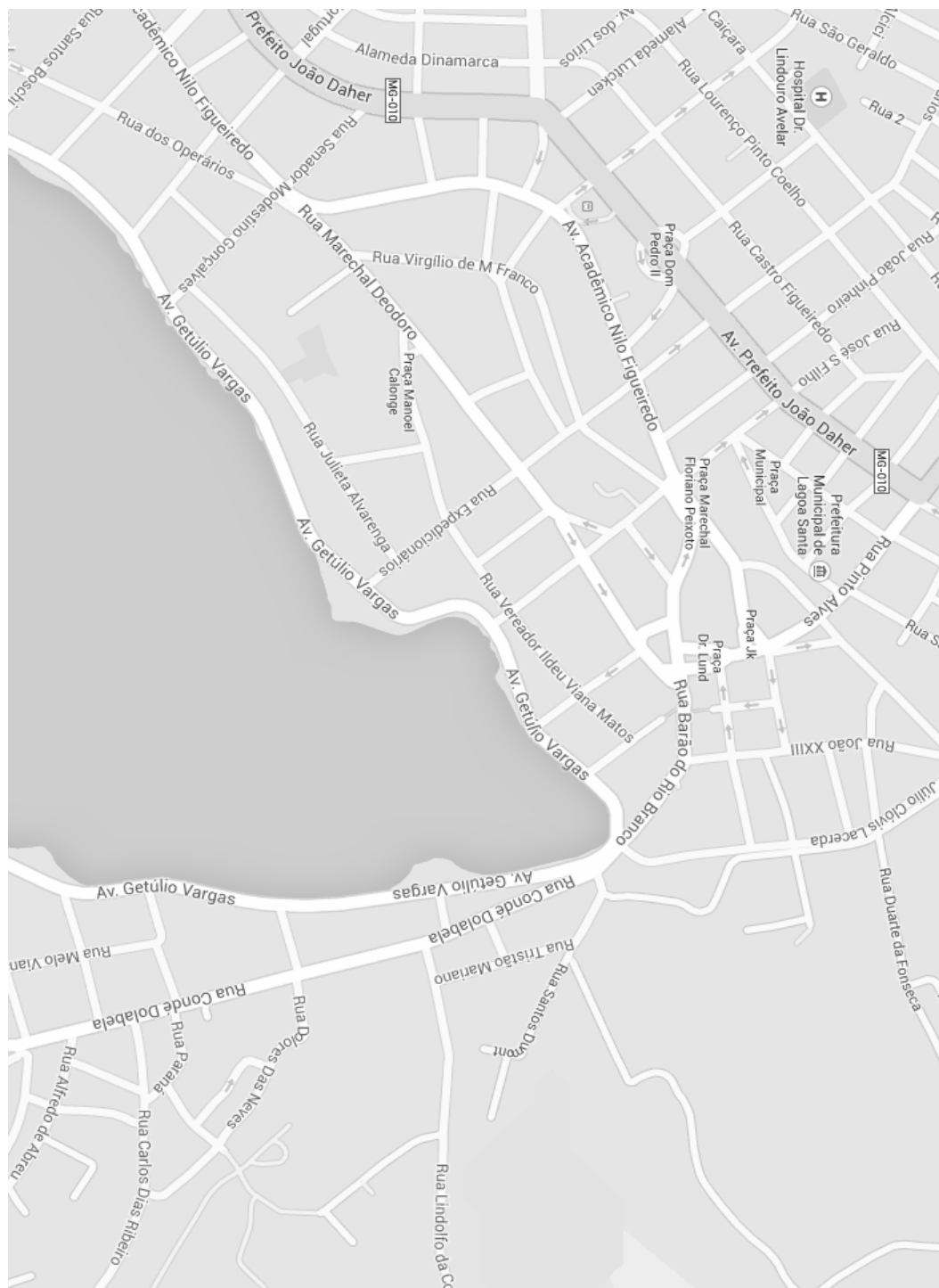
Figura 1 – ORLA DA LAGOA CENTRAL

Local possível de realização de eventos: Orla da Lagoa Central. Endereço: Avenida Getúlio Vargas, s/nº, centro – Lagoa Santa – MG.